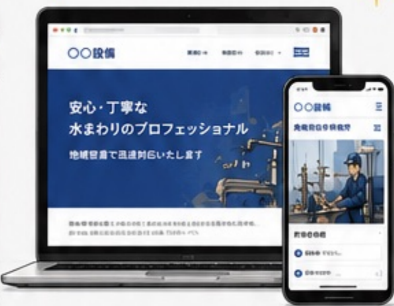
信頼されるサイトに